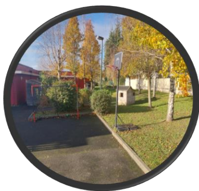
Espace de récréation extérieur