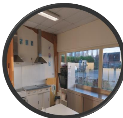
Atelier vie quotidienne