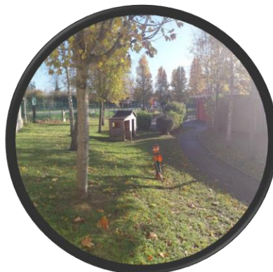
Espace sensoriel extérieur