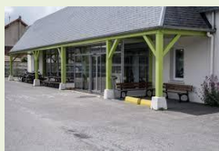
ESAT Dives Sur Mer

Sortie A13 N°29 Bus Nomad 111- Arrêt La roseraie