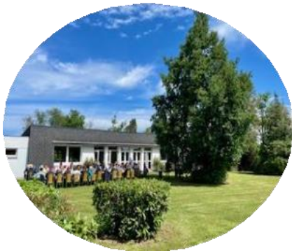
AIRE DE PIQUE-NIQUE